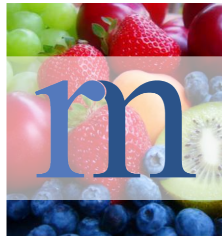
Sur une photo le logo est posé sur un fond blanc opaque à 60%.